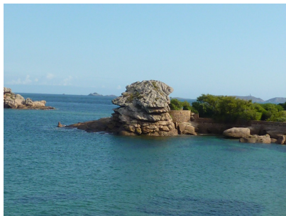
Le Tas de Crêpes de Trégastel

On dispose d'un tas de crêpes toutes de tailles différentes. Avec une spatule, on peut prendre un certain nombre de crêpes (au dessus du tas) et les reposer après les avoir retournées.