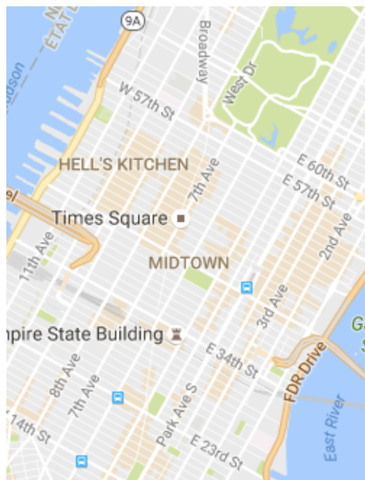
Centre de Manhattan