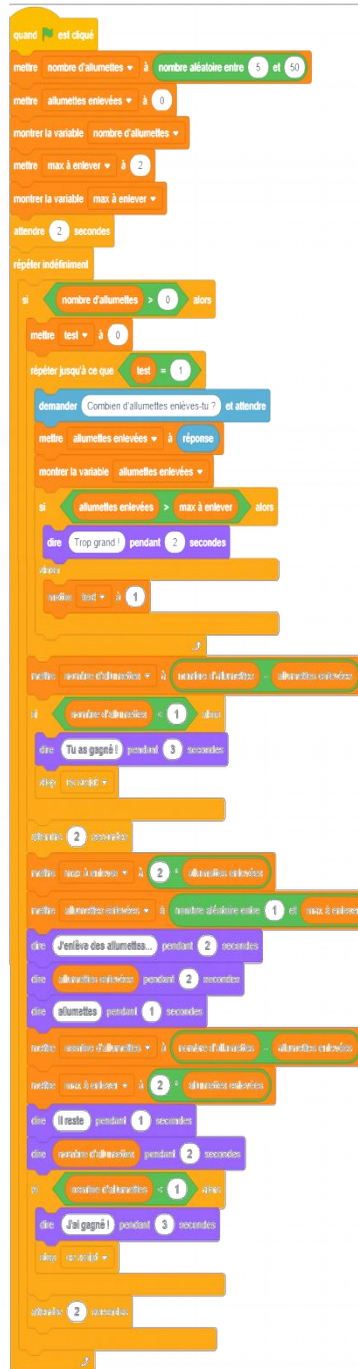
Illustration 1: Algorithme 1