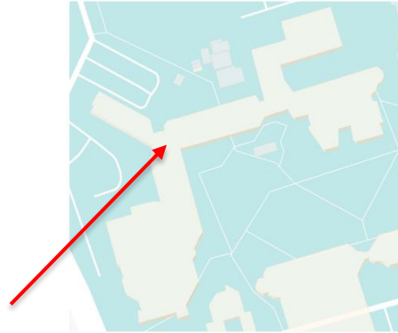
Figure 3: Bâtiment principal

Ensuite, observez une autre partie du complexe immobilier principal, qui apparaît sur la figure 3. Il s'agit d'un bâtiment très complexe. Comment les caméras doivent-elles être positionnées dans ce cas? En annexe vous trouverez un plan agrandi de ce même bâtiment.