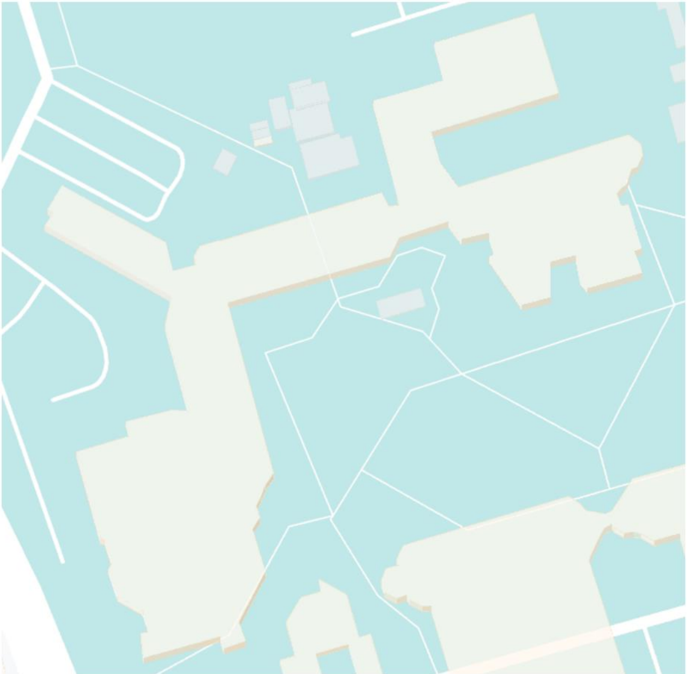
Figure 4: Bâtiment principal – en grand